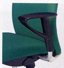
幅広のP.P.樹脂成型肘

柔軟性の高い背もたれ 柔軟性の高い背もたれが、身体の自然な動きをピタリサポートします。