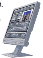
タッチパネルシステム

複数のAV機器の制御から、スクリーン、照明などの環境設定まで、一連の操作が、どなたでも簡単、確実に操作、確認できます。場所を選ばず、移動可能なワイヤレスタイプもご用意しています。