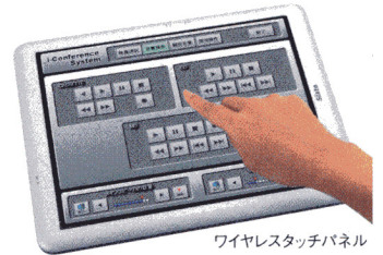
ワイヤレスタッチパネル