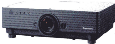
1チップDLP方式プロジェクター PT-D5700

大画面の高画質、迫力映像を実現するDLP™ プロジェクターにより、より印象度の高いプレゼンテーションを実現します。