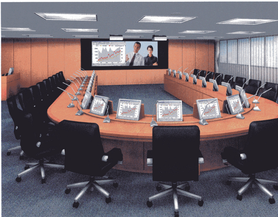
〈写真左〉役員会議室 / 〈写真右・上から〉大会議室・中会議室・小会議室のイメージ