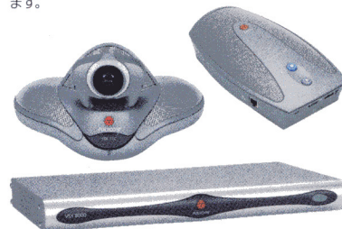
遠隔会議システム

コンパクトな一体型ボディに、高性能カメラとスピーカーを搭載。デジタルボードと組み合わせることにより、より詳細で、かつインタラクティブな会議が可能となります。拡張性の高いインテグレーションモデルもご用意しています。