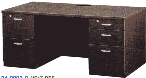
34-0093-0 VP17-DES ¥174,300(¥166,000)

W1800×D850×H720mm ■樹脂製ペントレー(右袖のみ)、カギ(上段のみ) 幕板配線穴付