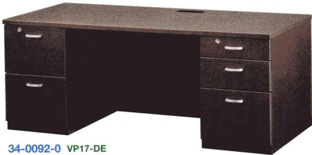
34-0092-0 VP17-DE ¥185,850(¥177,000)

W1800×D850×H720mm ■樹脂製ペントレー(右袖のみ)、カギ(上段のみ) 幕板配線穴付