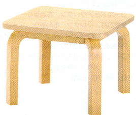
コーナーテーブル 30-0126-0 TTV-66 ¥69,195(¥65,900) W600×D600×H450mm ●天板芯材/パーティクルボード 天板/抗菌メラミン化粧板、木目柄エッジ 脚部/フナ集成材、ウレタン塗装、アジャスター付