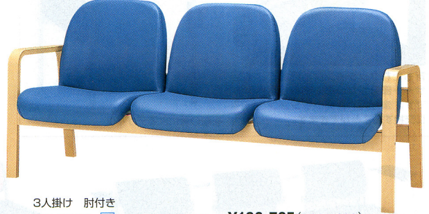
3人掛け 肘付き 30-0124-□ FLW-3V-□ ¥138,705(¥132,100) W1680×D680×H760 SH380mm