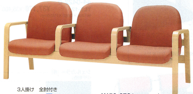
3人掛け 全肘付き 30-0120-□ FLW-3AV-□ ¥156,870(¥149,400) W1760×D680×H760 SH380mm