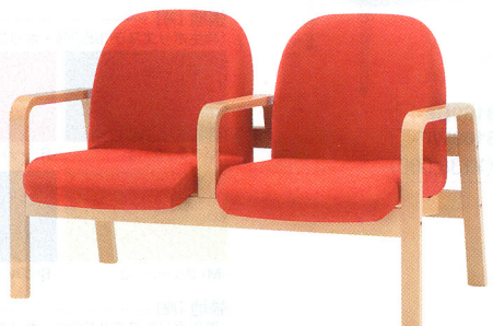
2人掛け 全肘付き 30-0121-□ FLW-2AF-□ ¥130,725(¥124,500) 30-0122-□ FLW-2AV-□ ¥113,715(¥108,300) W1190×D680×H760 SH380mm