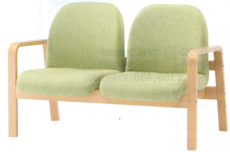
2人掛け 肘付き 30-0117-□ FLW-2F-□ ¥116,865(¥111,300) 30-0125-□ FLW-2V-□ ¥104,580(¥99,600) W1150×D680×H760 SH380mm