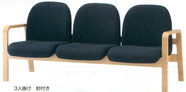
3人掛け 肘付き 30-0123-□ FLW-3F-□ ¥163,695(¥155,900) W1680×D680×H760 SH380mm