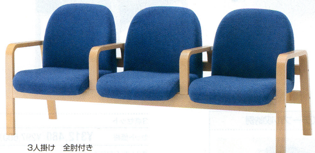
3人掛け 全肘付き 30-0119-□ FLW-3AF-□ ¥181,965(¥173,300) W1760×D680×H760 SH380mm