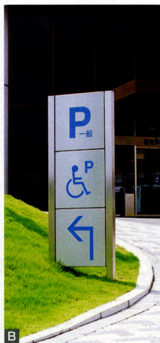
A 96-2001-0 OS-12091-SH ¥863,100 (¥822,000)

W900×D380×H4500mm 材質/ステンレス、ヘアライン仕上 表示/カットフィルム