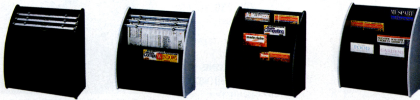
811R(ローズ) 811S(シルバー) 812R(ローズ) 812S(シルバー)