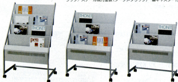
A4判3列4段 43-0201-0 NMRE-340 ¥44,835(¥42,700) W700×D460×H1100mm

●再生樹脂10%以上 本体/スチール横円パイプ ラック/スチール焼付塗装(ダークメタリック) ■キャスター付