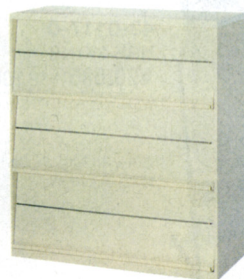
3段 26-0635-0 MR-3N ¥55,125(¥52,500)