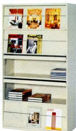
5段 26-0636-0 MR-5N ¥80,325(¥76,500)