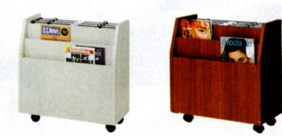
NG(ニューグレー) T(チーク)