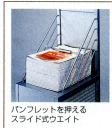
パンフレットを押える スライド式ウエイト