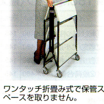
ワンタッチ折畳み式で保管スペースを取りません。