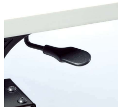
■折りたたみ操作レバー 両サイドに付いているどちらか一方のレバー操作により天板フラップが可能です。