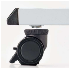
■アジャスト機能付キャスター キャスター上部のリングにより高さ調節できます。制動力の高いリフトロック式ストッパーです。