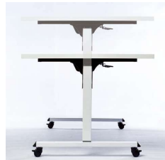
■ラチェット式高さ調節 テーブルの高さをH700からH1000まで50mmピッチ6段階の高さ調節可能です。(H1000時には高さ確認の刻印付)