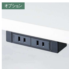
電源コンセント G001E-B ¥15,000 電源コンセント:2口 (15A 125V 2mコード付) ※USBタイプもございます。