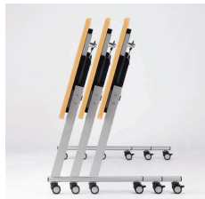
■サイドスタッキング

別製対応 …SIAA登録の抗ウイルス・抗菌天板での製作が可能です。詳細はP.013をご覧ください。