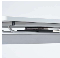
■スチールパイプ棚

キャスター上部のリングにより高さ調節できます。制動力の高いリフトロック式ストッパーです。