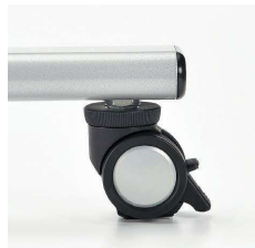
■アジャスト機能付キャスター

キャスター上部のリングにより高さ調節できます。制動力の高いリフトロック式ストッパーです。