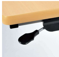
■折りたたみ操作レバー