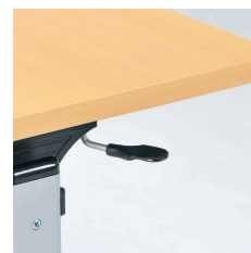
■折りたたみ操作レバー