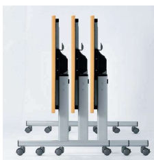
■サイドスタッキング スタックピッチ141mm

別製対応 ...SIAA登録の抗ウイルス・抗菌天板での製作が可能です。詳細はP.013をご覧ください。