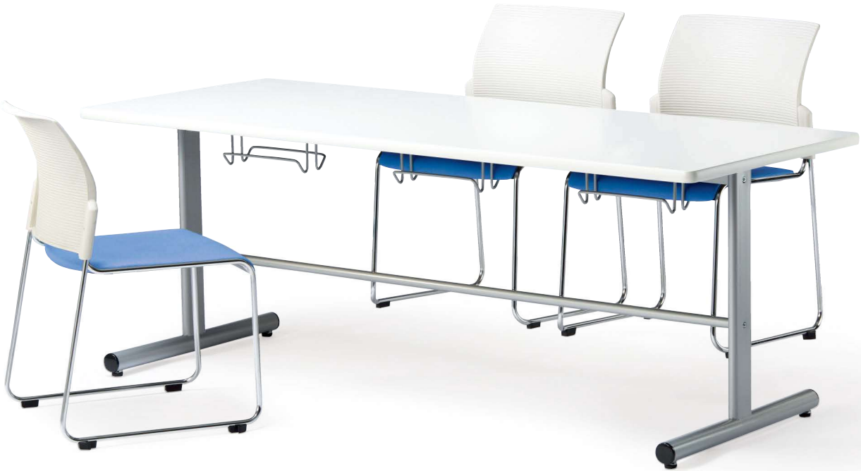
テーブル HGS-1875-WH チェア FC-88VW-BL (P.242)