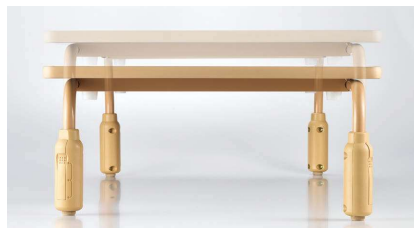
■回転ロック式高さ調節

別製対応 …SJAA登録の抗ウイルス・抗菌天板での製作が可能です。詳細はP.013をご覧ください。