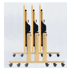
■サイドスタッキング

キャスター上部のリングにより高さ調節 できます。制動力の高いリフトロック式 ストッパーです。