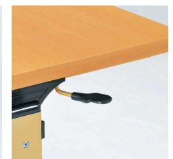
■折りたたみ操作レバー