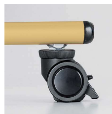
■アジャスト機能付キャスター

ABS樹脂エッジ(EB) 硬質タイプの樹脂エッジで耐久性・密着性に優れています。