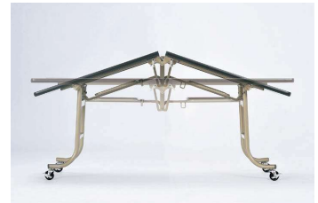
■セーフティロック機構

天板を水平にする際、両手を使って操作するため手挟みの心配がありません。また、安全性を考慮した2段階ストップ機構となっています。