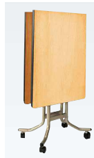
■折りたたんだ状態

シナ合板 単板の表面にシナ材を張り、クリア塗装をした素材です。 ※テーブルクロスを使用を前提にご利用ください。