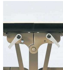
■天板折りたたみ操作レバー