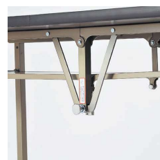
■天板折りたたみ操作ツマミ