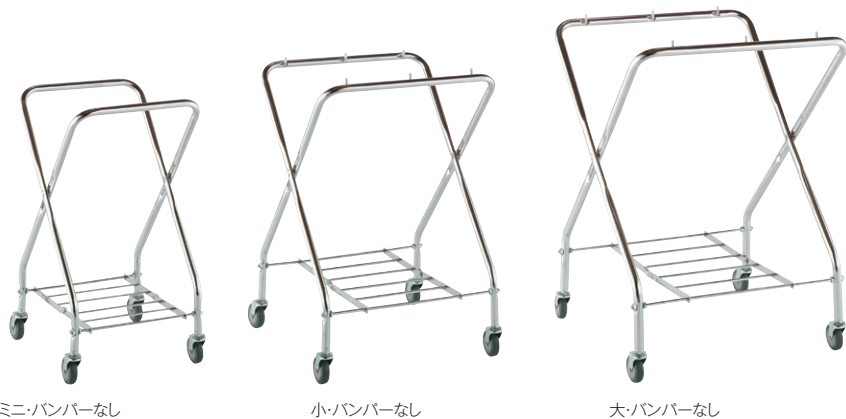
ミニバンパーなし