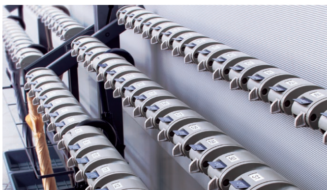
カードロック傘立II ▶P.125