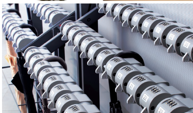
キーレス傘立トレス ▶P.124