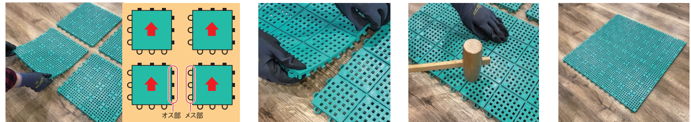
ジョイント部分が同じ方向になるように並べます。