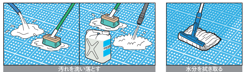
汚れを洗い落とす スノコ内部にこびり付いた砂などをデッキブラシで洗い流します。汚れのひどい場合は、中性洗剤の希釈液を散布し、高圧洗浄機を併用して洗った後、洗剤が残らないように十分に流水ですすいでください。