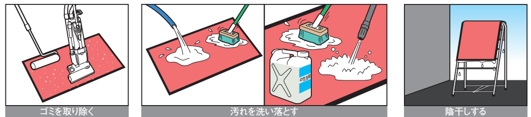
ゴミを取り除く マット上のゴミや砂塵を粘着ローラーや掃除機などで吸い取ってください。

表面が繊維で覆われており、主に塵やホコリ、細かな砂による汚れが中心となるマットに有効です。