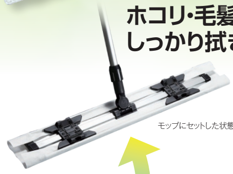
モップにセットした状態