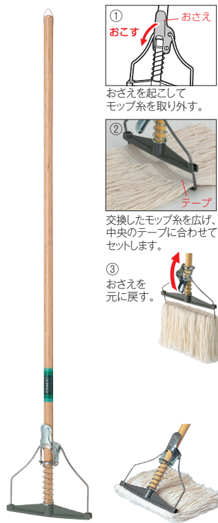
別売の替糸を付けた状態