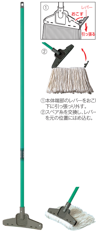
別売の替糸を付けた状態