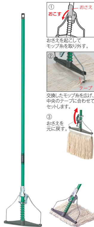
別売の替糸を付けた状態