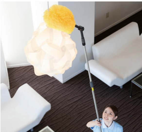
使用例:ハウスポール・ハウスポールベンダー・アフロクリーン