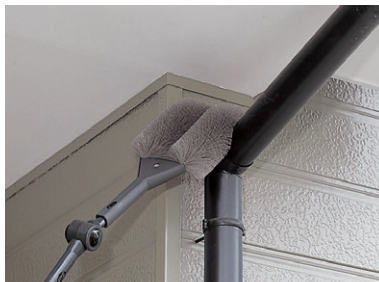
使用例:ハウスポール・ハウスポールベンダー・すみっこブラシ