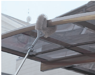
使用例:ハウスポール・ハウスポールベンダー・ハートブラシ