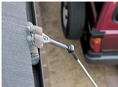
使用例:ハウスポール・ハウスポールベンダー・マルチブラシ