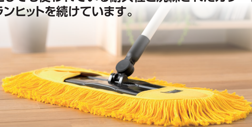
ニューシャインモップ40(糸付)

業務用としても使われている耐久性と洗練されたカラーリングでロングランヒットを続けています。