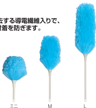
ミニ M L