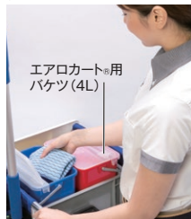
エアロカート®用 バケツ(4L)

専用バケツ(別売)でクロス などを分別して収納可能。 ▶P.467 仕切付きバケツII(別売)を セットすることができます。 ▶P.389 清掃プラパネル(別売)を セットすることができます。 ▶P.479