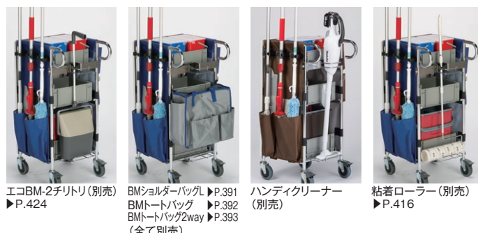
エコBM-2チルトリ(別売) ▶P.424