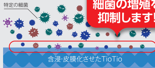
エアロカート®Σ ロング TioTioサイドカバー イメージ図