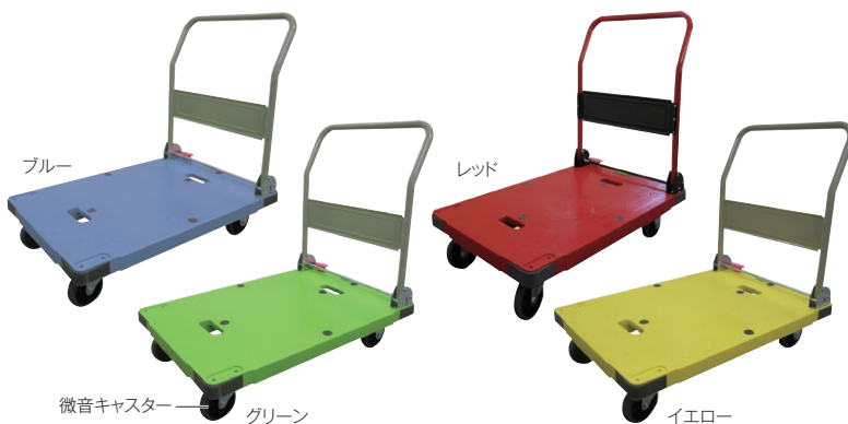
ブルー グリーン イエロー

静かでスムーズな微音キャスター。折りたたみば平台車にもなり、荷崩れ防止ガイド付きです。