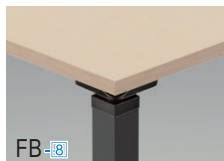
天板/ファインウッド 本体/ブラック