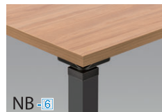
天板/ナチュラルブラウン 本体/ブラック