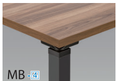
天板/モカブラウン 本体/ブラック