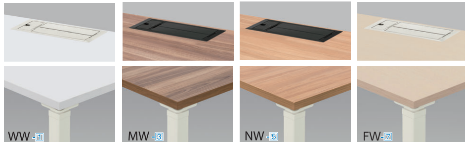
天板/ホワイト 本体/ホワイト