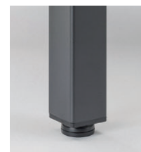
安定性のあるアジャスター脚。