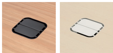
天板/ナチュラルブラウン