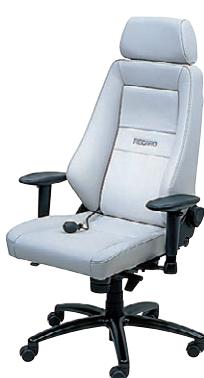
LG (レザーライトグレイ817) -[2]