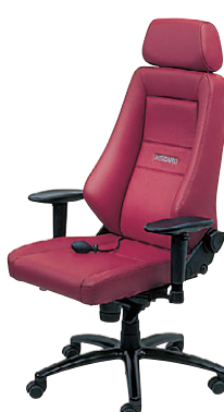
LW (レザーワインレッド818) -[4]