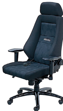
NK (ナルドブラック351) -[1]