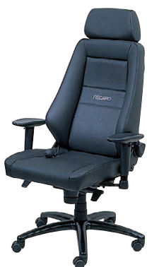
LK (レザーブラック816) -[1]