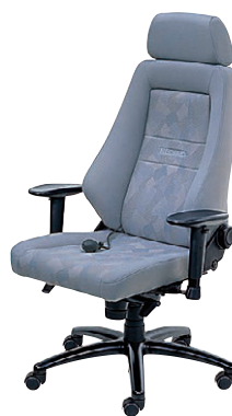
NG (ナルドグレイ354) -[2]