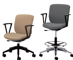
NEW QRCEチェア…P227 ¥59,000~131,100