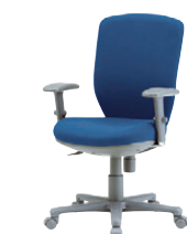
アドフィール AF-60/66…P238 ¥45,000~66,000