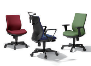
NEW アドフィール AF-70/77…P236・237 ¥43,800~54,400