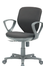
アドフィールライト…P241 ¥39,800~48,300