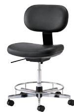
NEW 導電チェア…P242 ¥88,700・117,000