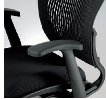
強化ナイロン樹脂成型肘