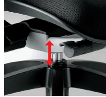
ガス上下調整レバー