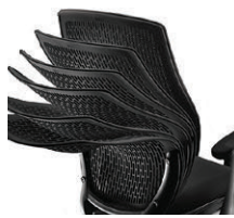
加重に合わせて自由に変形ベンディング