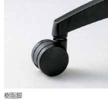
樹脂脚 φ60mm大口径ナイロン双輪キャスター