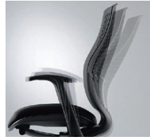
シンクロロック機構