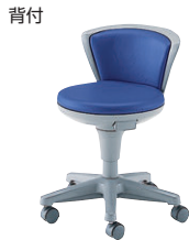
ビニールレザー/B(ブルー)