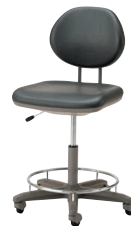
ビニールレザー (ダークグレー)

肘なし・リング付 44-0990-0 TELE-SD6C-Z ¥89,100 W460×D540×H885~1035 SH500~650 脚部/単輪ゴムキャスター、リング付(SD6L/C) カラー/布(ブルー)