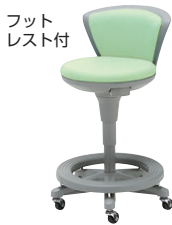
ビニールレザー/LM(ライトグリーン)