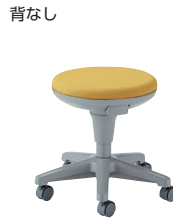
ビニールレザー/Y(イエロー)