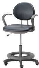
ビニールレザー (ダークグレー)

肘・ステップ付 44-0987-0 TELE-SD6AC-ST-Z ¥107,700 W570×D540×H885~1035 SH500~650 脚部/単輪ゴムキャスター、ステップ付 カラー/布(ブルー)