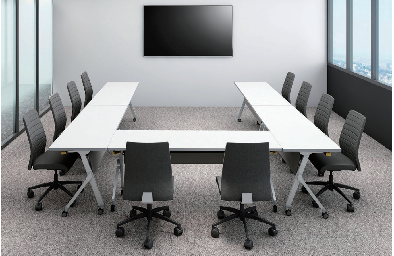
セット写真のテーブル STV-1845HM-W