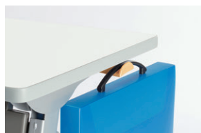
ユニバーサルデザインのフックタイプレバーハンドル