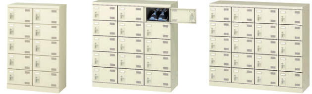
⑦ SLB-M10-S2 ⑧ SLB-M15-S2 ⑨ SLB-M420-S2

■錠バリエーション ご希望により受注生産にてお好みの錠を取付けいたします。詳しくは担当者におたずねください。