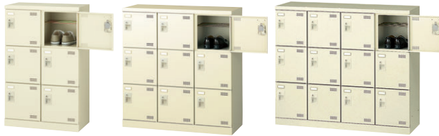
① SLB-M6-S2 ② SLB-M9-S2 ③ SLB-M412-S2