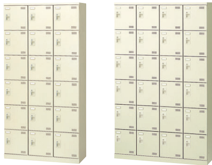
⑩ SLB-18-S2 ⑪ SLB-424-S2