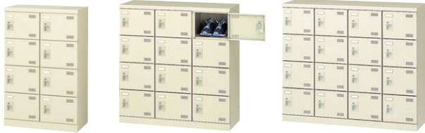
④ SLB-M8-S2 ⑤ SLB-M12-S2 ⑥ SLB-M416-S2