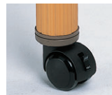
ストッパー付キャスター