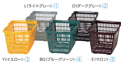
Y(イエロー)-③ BG(ブルーグリーン)-④ E(マロン)-⑤