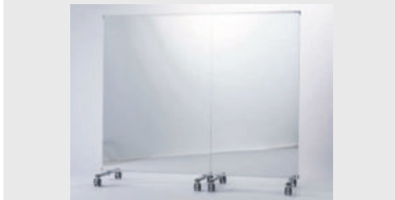
連結金具で複数台つなげてご使用いただけます