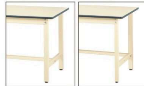
中央にセット 後ろにセット

ツナギパイプ用の取付穴は、前・中央・後の3ヶ所に空いています。ご希望の場所にセットできます。