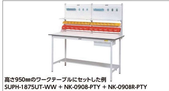
高さ950mmのワークテーブルにセットした例 SUPH-1875UT-WW + NK-0908-PTY + NK-0908R-PTY