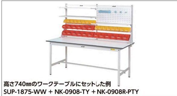
高さ740mmのワークテーブルにセットした例 SUP-1875-WW + NK-0908-TY + NK-0908R-PTY